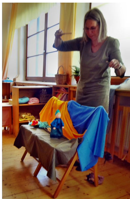
Gemma s loutkama v Praze

O dalším semináři řekněme více až postoupíme s orientačními rozhovory během léta. Více informací: www.ikruh.cz