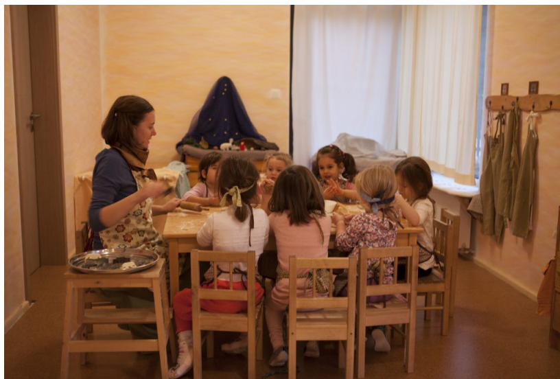
Pečení chleba v nové školce Hájanke v Bratislavě

Školka se přestěhovala na podzim na Petržalku, čtvrt' na jižním břehu Dunaje. Tam našli místo ve společenském centru, a dostala nové jméno: „Hajanka“. Hajanka má zatím skupinu deseti dětí ve věku 2,5-4,5 a skupinu třinácti dětí ve věku 4,5-6,5 let. Museli zde pilně pracovat na přípravě prostor, také kvůli schválení úřady. Ještě zde není možnost připravovat vlastní obědy, ty jsou sem dováženy od jinud. Doufají, že v létě bude zrealizováno rozšíření kapacity kuchyně a ještě několik dalších vylepšení, venku i uvnitř, jako hrací domečky, houpačky a klouzačky. Hajanka na to dostala sponzorský dar od Nadace pro Podporu pedagogiky Rudolfa Steinera z Nizozemska. Srdečný dík za to! Webové stránky Hájaneky : http://hajanka.sk