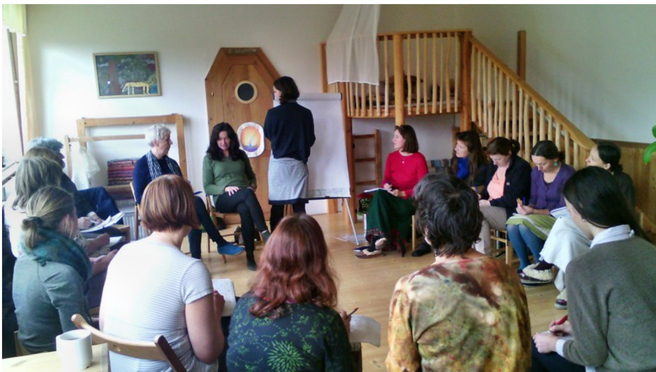
Seminář pro mateřská centra 31-10-2016 – Praha ,Dusíkova